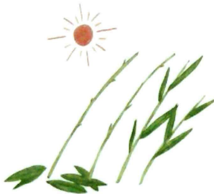
採集開花前的月桃植株，曬太陽半天