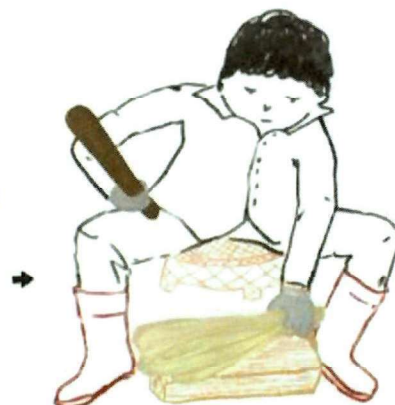
以木棍拍打葉鞘，使之鬆散變成絲狀